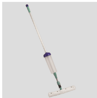
Spazzolone basic 01AA790145